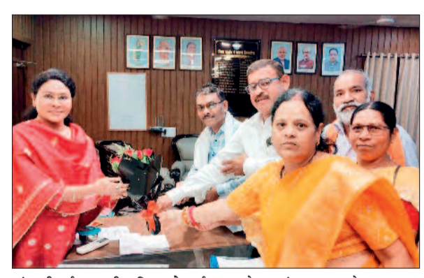
हरिभूमि न्यूज बालोद

हरिभूमि न्यूज बालोद जिले में ग्राम पंचायतों के समस्याओं को लेकर जिला सरपंच संघ ने ज्ञापन सौंपा। मांग पत्र में विकास कार्य, मनरेगा मजदूरी जल्द भुगतान करने, रिक्त पदों की पूर्ति करने और पंचायत प्रतिनिधियों के मानदेय बढ़ाने जैसे विषय शामिल हैं। कलेक्टर को सौंपे गए ज्ञापन में कहा गया कि जल जीवन मिशन के कई कार्य अधूरे हैं, इसके साथ ही वीबी जीरामजी योजना को लेकर स्पष्ट कार्ययोजना और समय पर स्वीकृति की मांग की गई, ज्ञापन में ग्राम पंचायतों में रिक्त सचिव और रोजगार सहायक के पदों में भर्ती की