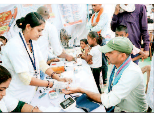
हरिभूमि न्यूज बालोद

जिला प्रशासन द्वारा आज गुण्डरदेही विकासखण्ड के ग्राम खुरसुनी में आयोजित जिला स्तरीय जनसमस्या निवारण शिविर में शामिल अंचल के 17 ग्राम पंचायतों के ग्रामीणों को पात्रतानुसार शासन के विभिन्न जनकल्याणकारी योजनाओं से लाभान्वित किया गया। इस दौरान शिविर में प्राप्त सभी 929 आवेदनों का मौके पर ही निराकरण सुनिश्चित किया गया।