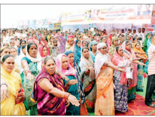
हरिभूमि न्यूज बालोद

सहित अन्य शासकीय योजना अनुसार सामग्री प्रदान की गई। राष्ट्रीय आजीविका मिशन बिहान के अंतर्गत 04 महिला स्व सहायता समूहों को डेमो चेक वितरण किया गया। इस मौके पर अतिथियों ने बच्चों को खीर खिलाकर उनका अन्नप्राशन संस्कार गर्भवती माताओं को सुपोषण किट भेंट कर उनके गोदभराई रस्म को पूरा किया गया।