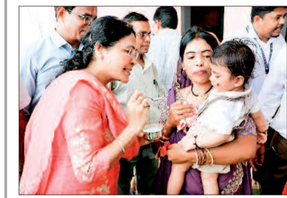
हरिभूमि न्यूज बालोद

जिला प्रशासन द्वारा आज गुण्डरदेही विकासखण्ड के ग्राम खुरसुनी में आयोजित जिला स्तरीय जनसमस्या निवारण शिविर में शामिल अंचल के 17 ग्राम पंचायतों के ग्रामीणों को पात्रतानुसार शासन के विभिन्न जनकल्याणकारी योजनाओं से लाभान्वित किया गया। इस दौरान शिविर में प्राप्त सभी 929 आवेदनों का मौके पर ही निराकरण सुनिश्चित किया गया।